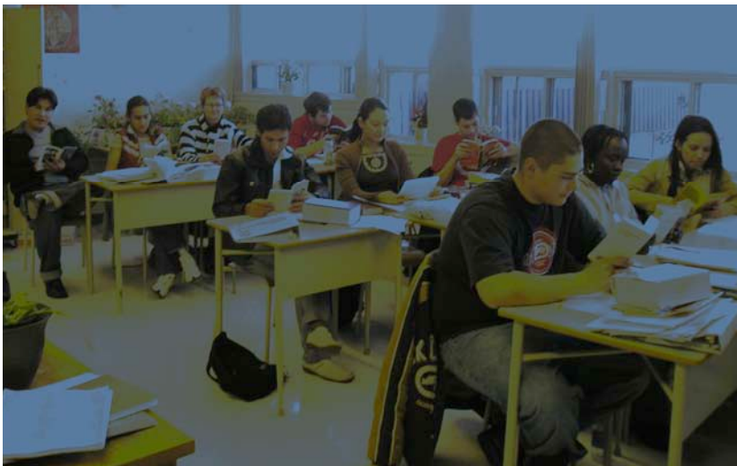
Classe d'Alphabétisation CRIF 2006